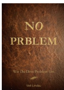
No Prblem von Veit Lindau