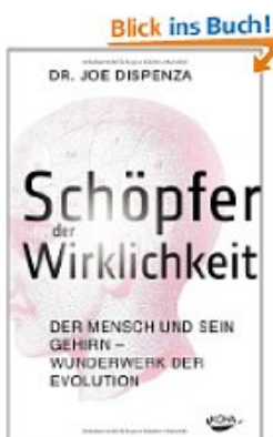
Schöpfer der Wirklichkeit: Der Mensch und sein Gehirn von Dr. Joe Dispenza