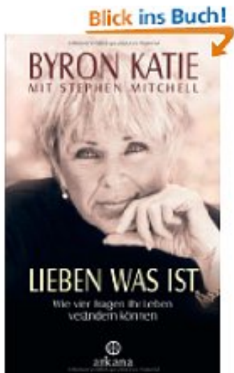
Lieben was ist: Wie vier Fragen Ihr Leben verändern können von Byron Katie