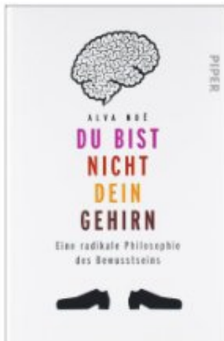
Du bist nicht Dein Gehirn von Alva Noe