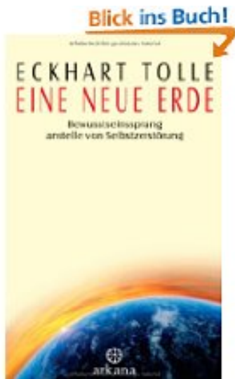
Eine neue Erde von Eckhardt Tolle